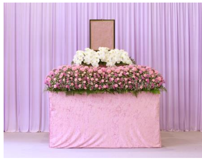
花祭壇 Aタイプの場合