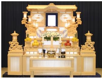
白木五段祭壇の場合